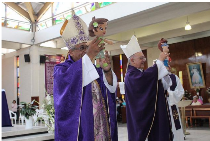
Promover la espiritualidad