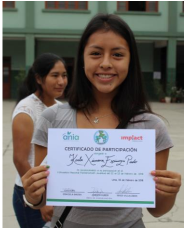
Formar agentes de cambio