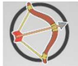
Toma de acción