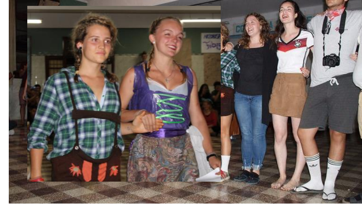
Promover la interculturalidad