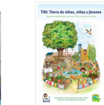
Proteger el medio ambiente