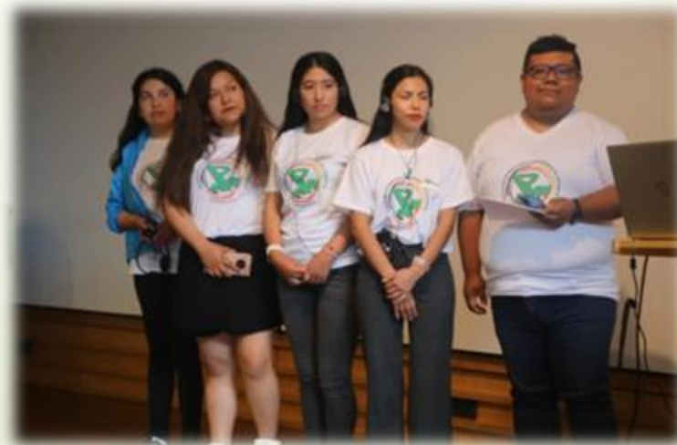
EQUIPO NACIONAL DE PARTNERSCHAFT JUVENTUD