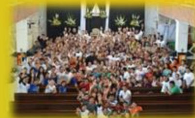
Compartir con los grupos parroquiales