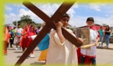
Realizar un viacrucis en nuestra comunidad