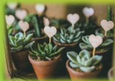
Regalar una plantita