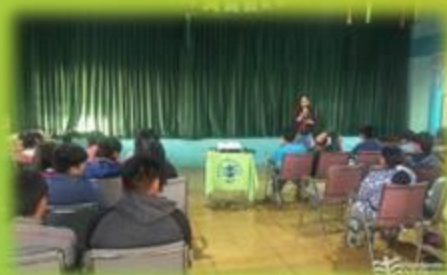
Transmisión en vivo