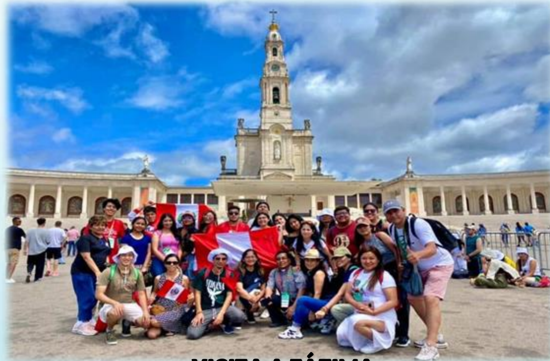
VISITA A FÁTIMA