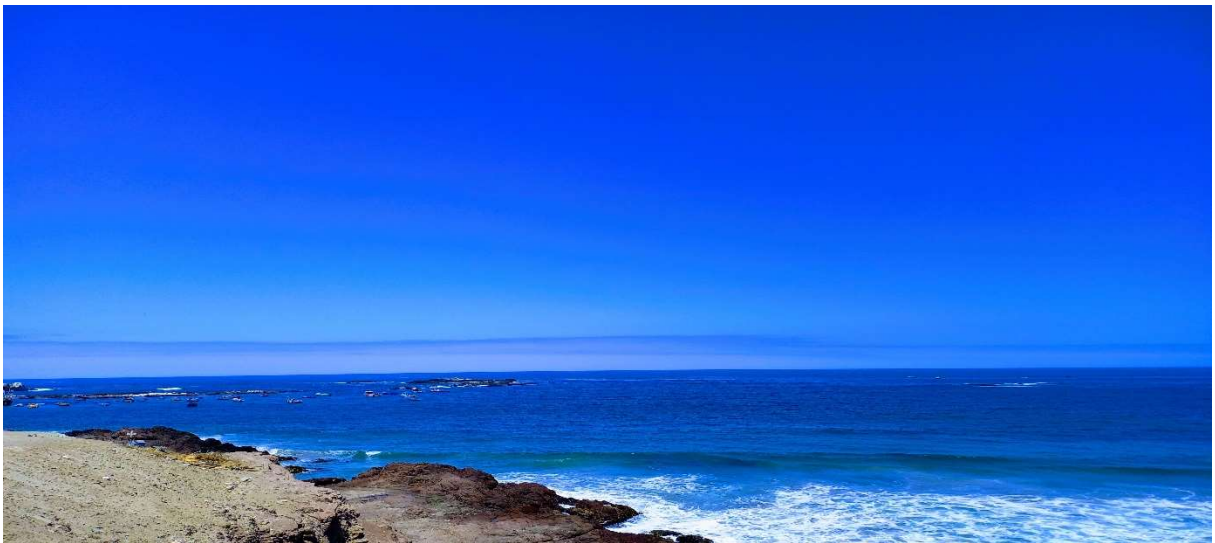
El mar de Chala

Requerimos no solo una revisión sino reforma de los lineamientos de la Partnerschaft como proponen en Friburgo. Para eso debemos seguir profundizando las preguntas en relación a los lineamientos de la Partnerschaft tanto a nivel parroquial, diocesano, regional, nacional y con nuestras Partner-Parroquias en Friburgo. Muchas gracias.