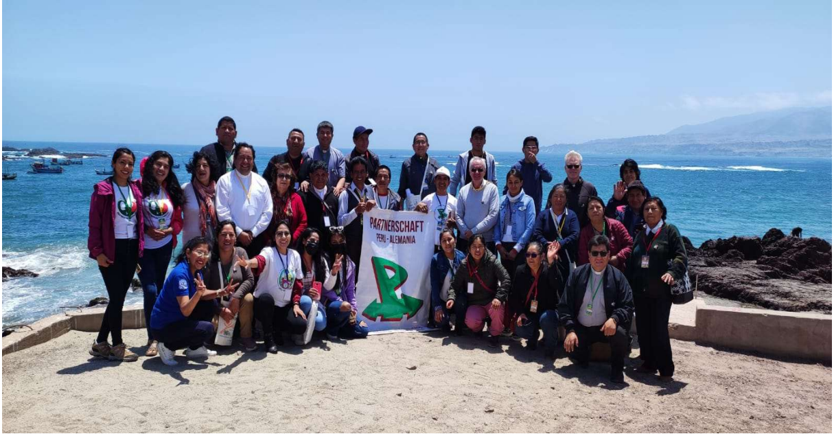
Foto grupal del Encuentro de Partnerschaft de la Región Sur en Chala frente al mar

Requerimos no solo una revisión sino reforma de los lineamientos de la Partnerschaft como proponen en Friburgo. Para eso debemos seguir profundizando las preguntas en relación a los lineamientos de la Partnerschaft tanto a nivel parroquial, diocesano, regional, nacional y con nuestras Partner-Parroquias en Friburgo. Muchas gracias.