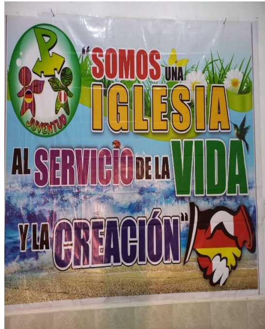
Encuentro de Parnerschal - Somos Iglesia al Servicio de la vida y la creación