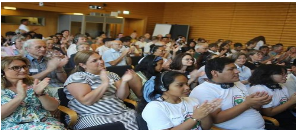
Participantes del Encuentro Internacional en Friburgo