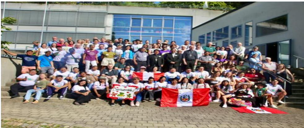
Participantes del Encuentro Internacional en Friburgo

Y un agradecimiento a todos y todas las participantes del 1º Encuentro Internacional de la Partnerschaft Juventud en Friburgo-Alemania y a las Partner-Parroquias de Friburgo y del Perú, así como el Consejo Nacional de la Partnerschaft y el Equipo de Coordinación Nacional: